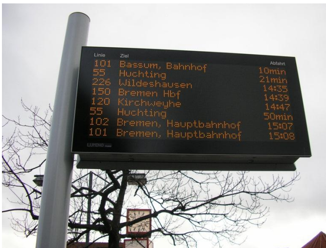
elektronische Anzeigetafel am zentralen Omnibusbahnhof (ZOB) Brinkum

Echtzeitdaten bedeuten für den Fahrgast, dass eventuelle Verspätungen der Busse sofort im Internet ( www.vbn.de und www.fahrplaner.de ) oder auf einem Smartphone-Handy (iPhone und Android mit der VBN-App) angezeigt werden. Auf allen anderen „normalen“ Handys sind diese Echtzeitdaten mittels des Internetbrowsers unter m.vbn.de abrufbar. Die Prognosen werden ab April 2012 zusätzlich auf den elektronischen Anzeigetafeln in der Region um Bremen dargestellt, z.B. am ZOB Brinkum (siehe Foto). Im Anschluss daran auch auf den vorhandenen elektronischen Anzeigetafeln der BSAG in Bremen.