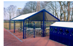
Oldenburg, 28. November 2007