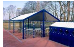
Achim, 20. Februar 2007