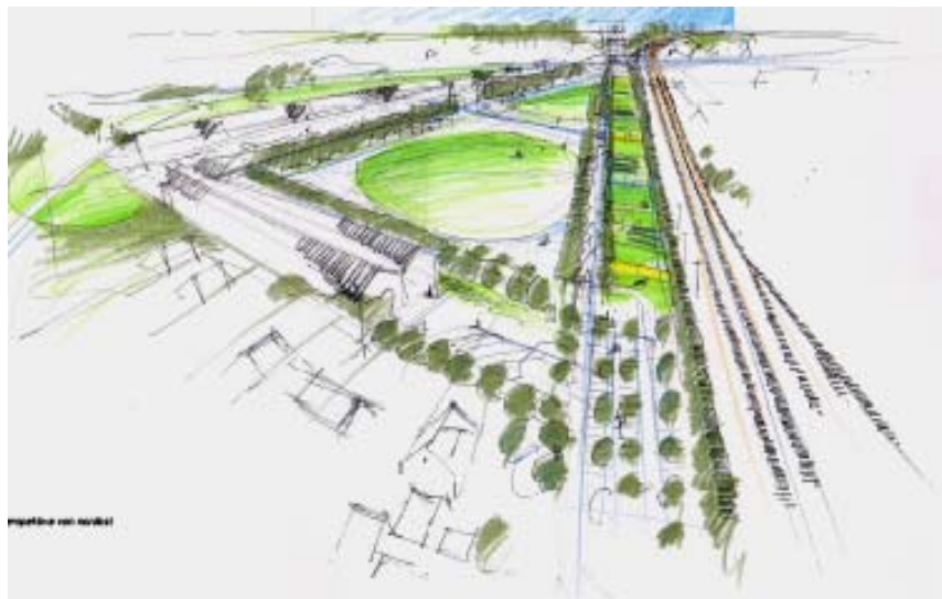
Vorschlag Louafi: Perspektive aus Richtung Bahnhof