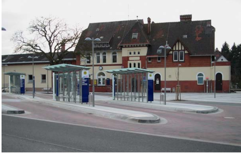
Neu gestalteter Bahnhofsvorplatz 2004/2005